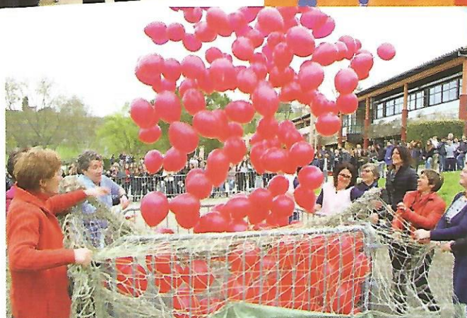
Un lâcher de ballon pour visualiser les promesses tenues